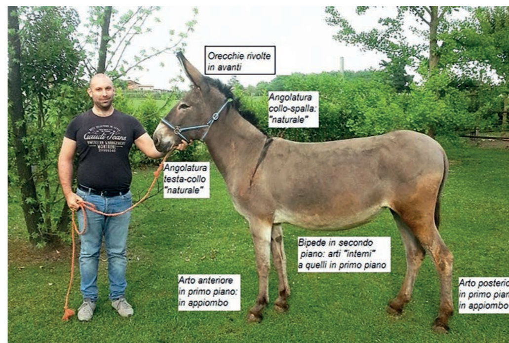
Posizione corretta per la valutazione della morfologia dell'asino

- Taglia: marcatamente diversa dallo standard.