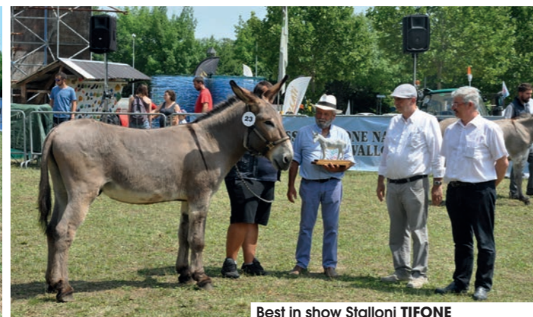
Best in show Stalloni TIFONE Soc. Agricola Fratelli Ghitti - Ghedi (BS)