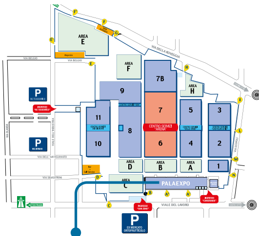
Centro Congressi PALAEXPO - Entrata A2